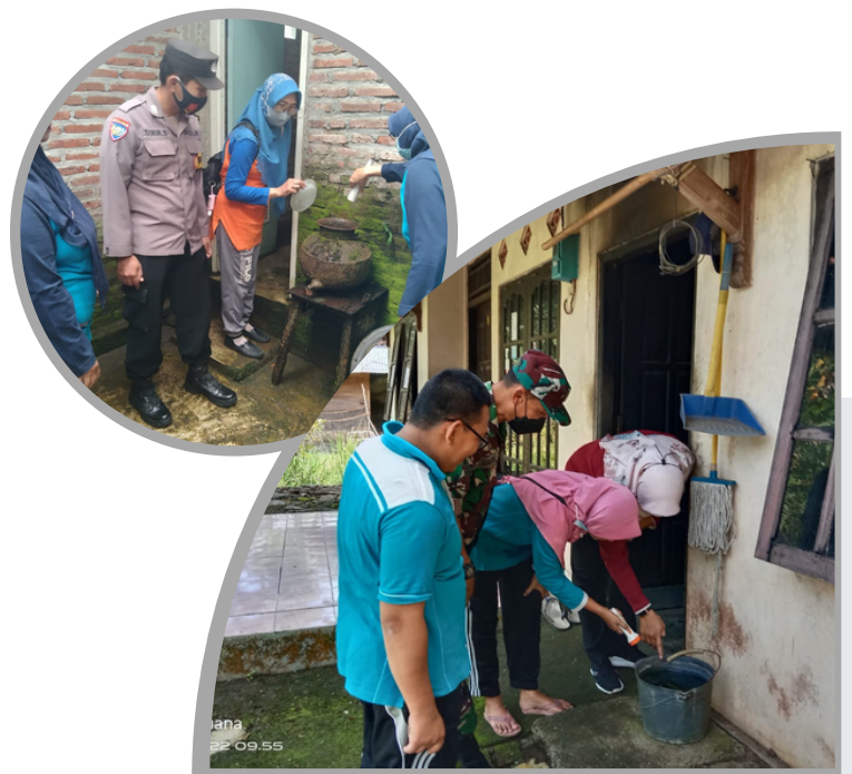
Gambar 2. Kegiatan Pemantauan Jentik

Kegiatan Gertak Mak Gotik dilaksanakan sebagai salah satu upaya untuk mencegah timbulnya, memutus rantai penularan, serta mengubah perilaku masyarakat dalam upaya pemberantasan penyakit demam berdarah. Kegiatan dilakukan secara serentak dengan tujuan untuk meningkatkan efektivitas dari upaya pemberantasan sarang nyamuk (PSN). Analoginya, ketika semua tempat potensial perindukan nyamuk dibersihkan secara bersama-sama, nyamuk tidak memiliki tempat perindukan sehingga menghambat perkembangbiakan nyamuk.