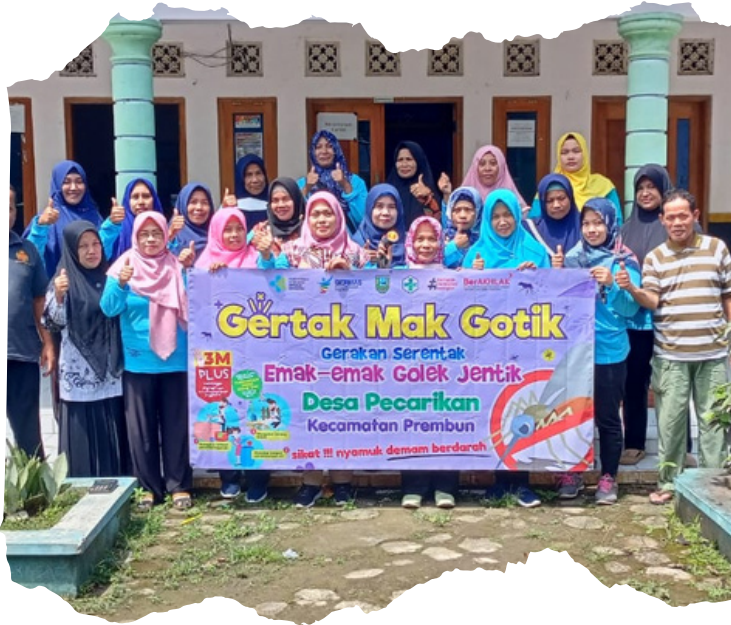
Gambar 1. Pelaksanaan Kegiatan Gertak Mak Gotik

Kegiatan ini dikoordinir oleh Bidan Pembina Wilayah dari Puskesmas Prembun. Selain melibatkan ibu-ibu kader, kegiatan juga melibatkan kepala desa, perangkat desa, dan tentunya warga masyarakat dari masing-masing desa.