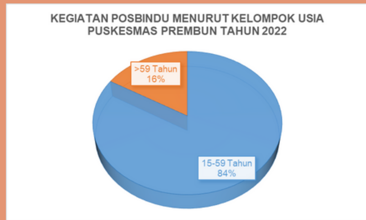
Gambar 2. Kegiatan Posbindu Puskesmas Prembun Tahun 2022