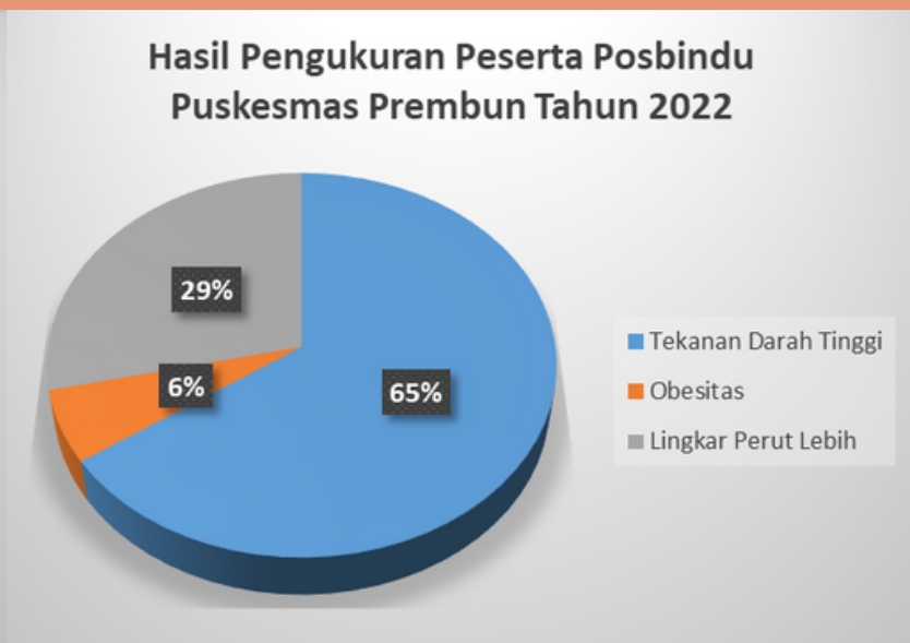
Gambar 5. Faktor Risiko PTM Peserta Posbindu Puskesmas Prembun Tahun 2022